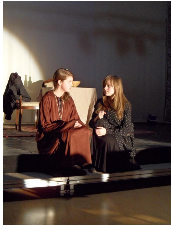
Bei der Generalprobe

„Es war die Nachtigall, und nicht die Lerche!“ – Es war die Lerche. Das sagt zumindest Ephraim Kishon, Meister der Parodien, der modernen Kurzgeschichten und der wohl provokanteste Autor in seiner Klasse – denn wer sonst würde das Meisterwerk „Romeo und Julia“ weiterführen? Das Publikum johlte – zugegebenermaßen dezent übertrieben – aber immerhin spornte es einige Schüler an, eine Rezension zu verfassen. Wenn Sie sich immer schon einmal gefragt haben: Was denkt denn bitte ein Schüler über Romeo und Julia? – finden sie nun hier die Antworten.