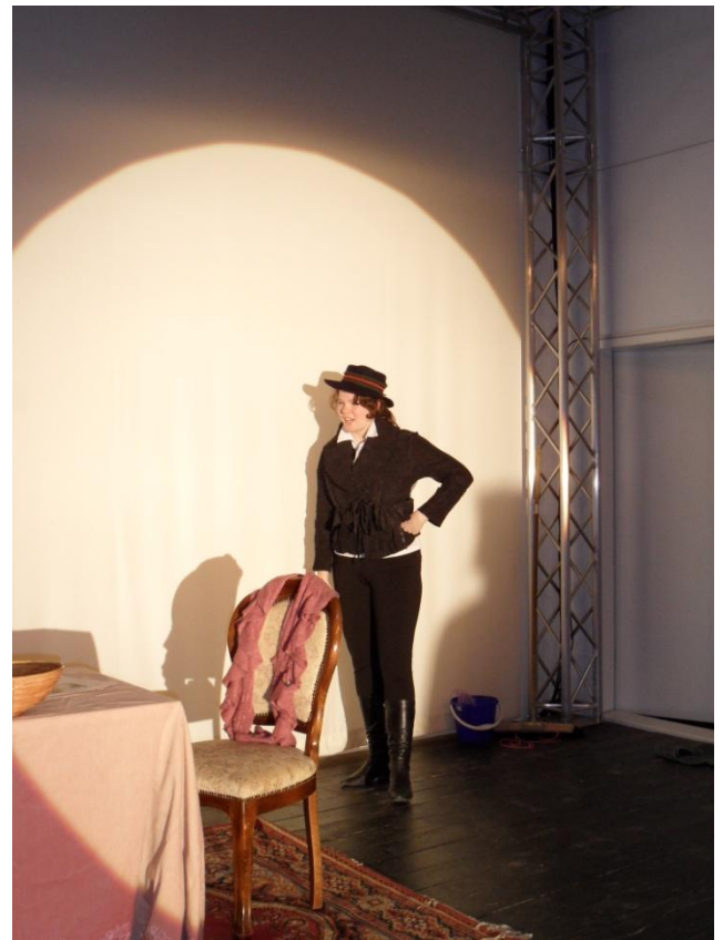
Shakespeare tritt auf

onsgruppe Erkner, die soeben einzig dafür gegründet wurde, sagt: Sehr gut!