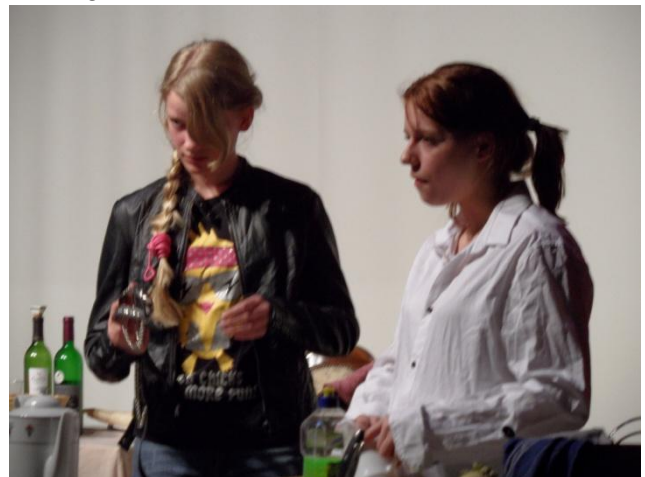
Julia und Lucretia im Gespräch