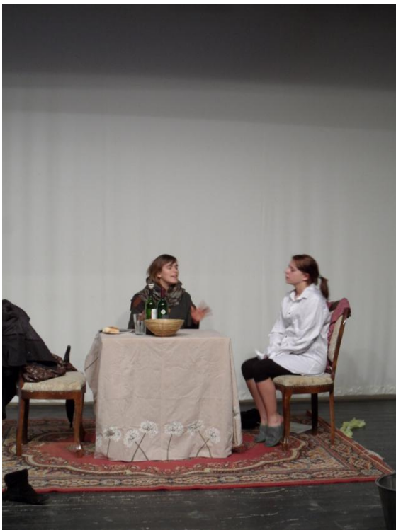
Romeo und Julia sind alt geworden

Es war ein kühler Tag im Januar. Es war Deutschunterricht. Alles war ruhig. Doch plötzlich verstanden alle, worum es ging. Die Wortgruppe „Romeo und Julia“ erweckte jeden, der bisher nur „Drama“ verstanden hatte. Denn Romeo und Julia ist wohl DAS Drama: Jeder Schüler kann den Text halbwegs auswendig, und nun bat sich den Neuntklässlern, bei denen sich Romeo und Julia nun 'dem Ende neigte', die Gelegenheit, endlich einmal Textausschnitte mitsingen zu können.