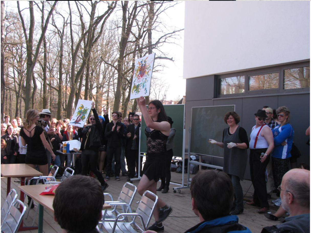
Impressionen vom letzten Schultag 2012